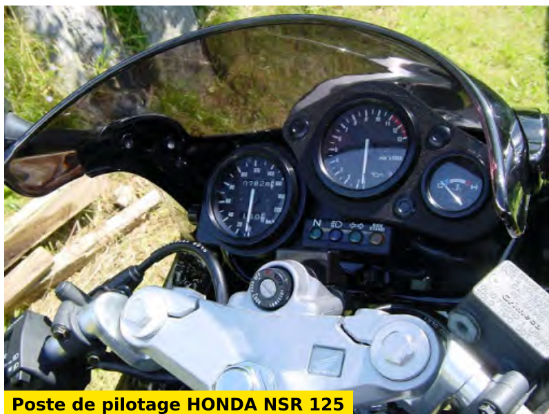
Poste de pilotage HONDA NSR 125

Pour une utilisation en ville, cela devient assez compliqué. En effet au vu de sa longueur, le rayon de braquage est énorme (demi-tour presque impossible) et les slaloms entre les voitures sont une épreuve car en dessous de 7000 tours le moteur manque de puissance. Cela dit elle décolle rapidement des feux rouges, même en version bridée à 15 chevaux. Mais c'est surtout sur route qu'elle développe réellement son potentiel avec une bonne vitesse de pointe et une bulle très efficace. La conduite sur autoroute, par contre, est possible mais potentiellement périlleuse si la moto n'est pas débridée. Ses freins très puissants, mais totalement gérables, étaient un vrai atout. Et compte tenu de la puissance de la moto, ils étaient bienvenus.