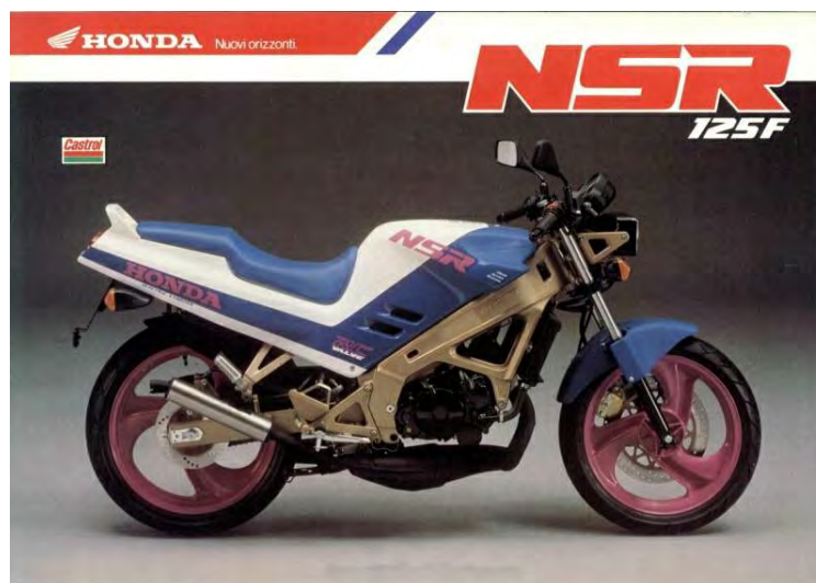
HONDA NSR 125 FL

En conclusion la NSR 125 était une véritable petite sportive avec un très bon rapport qualité/prix. Ses lignes racées font d'elle une moto de course à part entière, avec un entretien raisonnable et un confort de conduite assez bon. On notera tout de même ses phares qui ne sont pas du tout à la hauteur du reste. Un autre problème viendra aussi des carénages, si l'on souhaite les changer, cela devient vite compliqué compte tenu de leur prix très élevé.