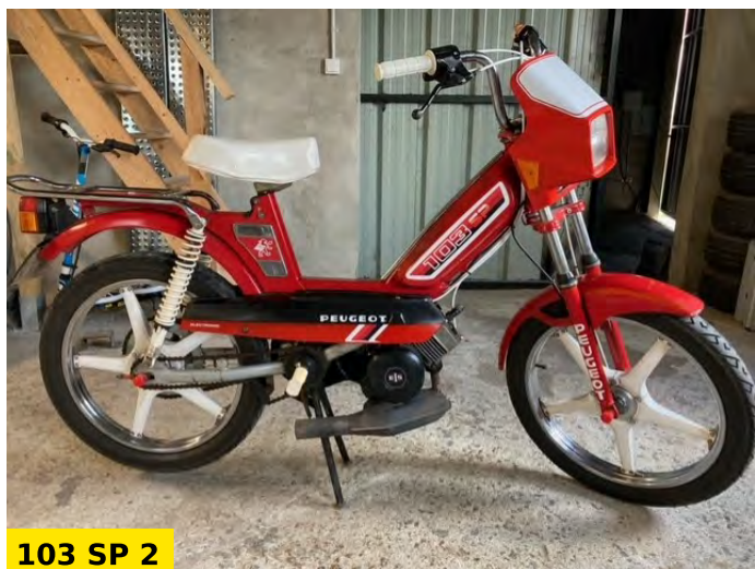
103 SP 2

On démarre avec les 103 RCX, avec dans un premier temps ce RCX Phase 2 vert et noir et son réservoir 5 litres. Sur ce modèle on retrouve un moteur liquide qui est d'origine. A côté, le RCX LC Phase 1 dans sa version bleue et blanche et son réservoir de seulement 3,7 litres. Sur ces deux modèles Hervé a mis un carburateur et une pipe d'admission de 15, et les deux sont équipés du désormais célèbre pot à pompe GENCOD en vert et en bleu.