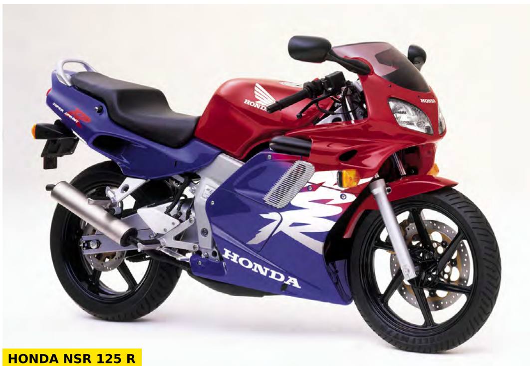
HONDA NSR 125 R

Il a existé beaucoup de déclinaisons de la NSR 125, comme par exemple la NSR 125 R / F (JC20) ou bien la NSR FL 125.