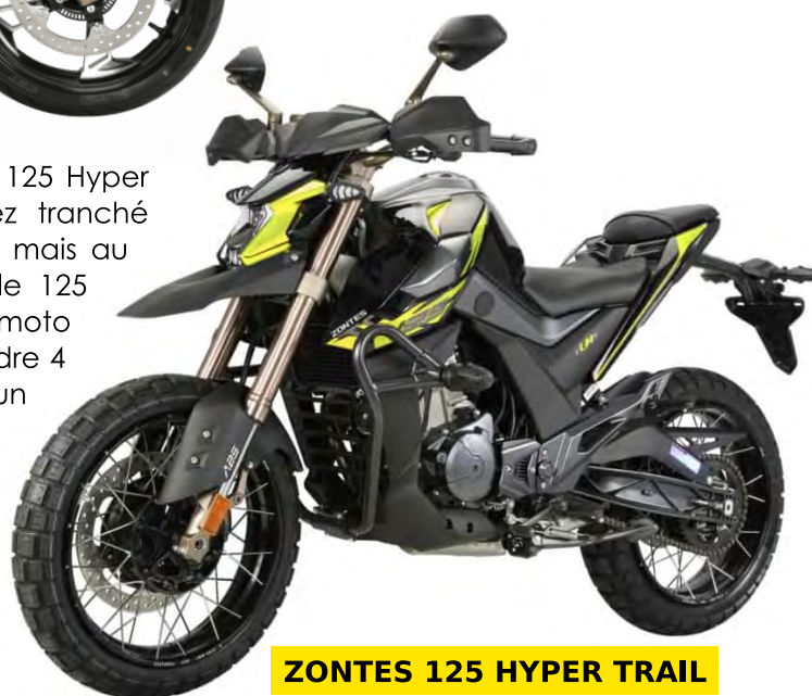
ZONTES 125 HYPER TRAIL

Toujours chez Zontes, l'arrivée pour 2021 du modèle 125 Hyper Trail. Le visuel de cette petite cylindrée est assez tranché (comme peuvent l'être les modèles de la marque), mais au delà de ce style particulier se cache une véritable 125 moderne. Là aussi l'éclairage est à LED et la moto respecte la norme Euro 5 avec un moteur monocylindre 4 temps. Elle adopte des pneus à crampons, malgré un look global à vocation supermotard. Avec ce modèle, Zontes a pris le parti de l'originalité et de l'unicité, ce ne sera peut-être pas la plus populaire mais c'est assumé. L'Hyper Trail 125 sera disponible au prix de 3590€.