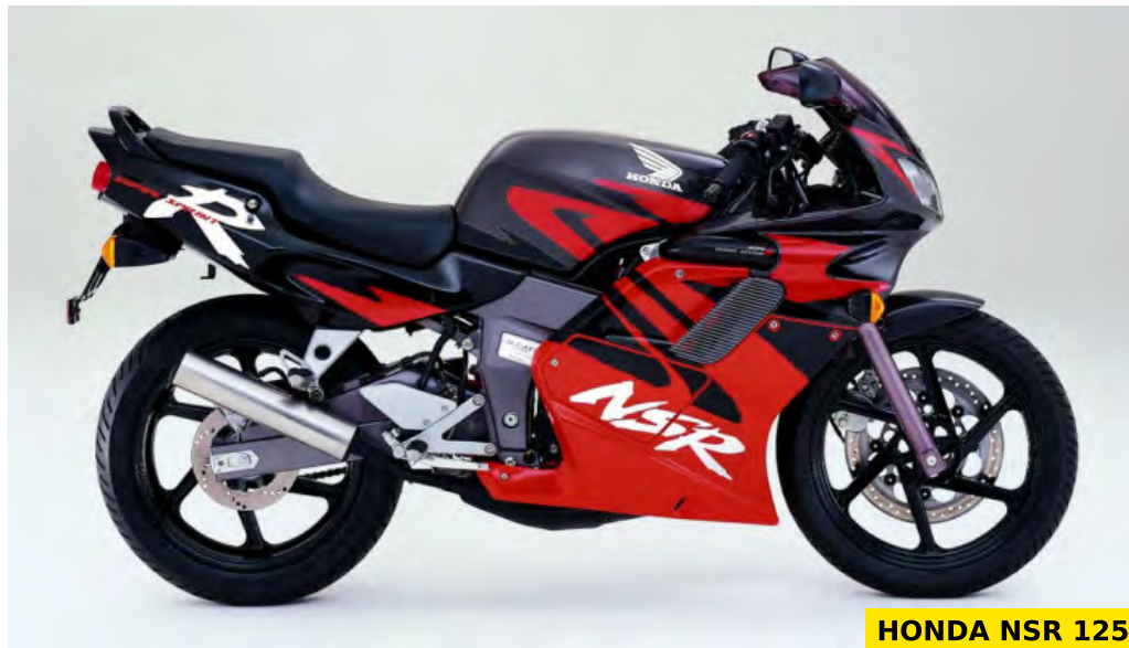
HONDA NSR 125

Dans cette séquence nostalgie on vous emmène en 1988, année de naissance de la Honda NSR 125, la plus célèbre des NSR, héritière de la NS 125 F de 1985.