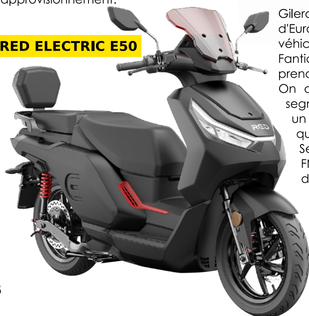
RED ELECTRIC E50

Gilera, Derbi et Aprilia ont vendu leurs derniers modèles avant l'arrivée d'Euro 5. Ces constructeurs ont préféré abandonner et ne pas adapter leurs véhicules à la nouvelle norme. Dans les belles réussites de l'année on notera Fantic qui réalise +143%, Masci avec +121,3%, Sherco (+25,5%) de son côté prend la place de MASH qui s'effondre avec -65,5%. On aurait pu croire à une belle année pour l'électrique mais c'est le segment qui s'en sort le moins bien avec un bilan annuel à -16,7% malgré un mois de Décembre solide à +101,4%. La réussite vient de Red Electric qui tire le segment vers le haut avec +2022,2% sur le mois de Décembre. Ses bons chiffres sont dus en partie à sa distribution dans le réseau FNAC / DARTY. En tête du classement : Super Soco qui prend la place de NIU. Sur-Ron, que l'on a vu débarquer en force avec ses VTT / Motos en début d'année 2020, réalise +324,1% sur l'année.