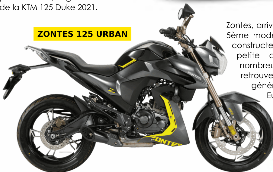
ZONTES 125 URBAN

Zontes, arrivé en France depuis peu, en est déjà à son 5ème modèle vendu dans l'hexagone. Pour 2021 le constructeur chinois nous présente la 125 Urban, une petite cylindrée aux lignes fuselées et aux nombreuses composantes électroniques. On y retrouve un éclairage LED, un ABS Bosch dernière génération et une motorisation homologuée Euro 5. La petite urbaine s'affiche au prix de 2990€, ce qui est tout de même un bon rapport qualité / prix compte tenu de la composition de la moto.