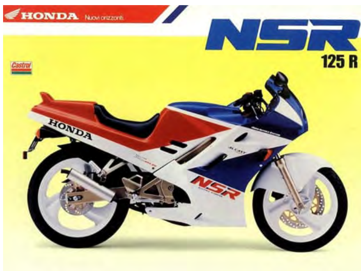
HONDA NSR 125 R/F (JC20)