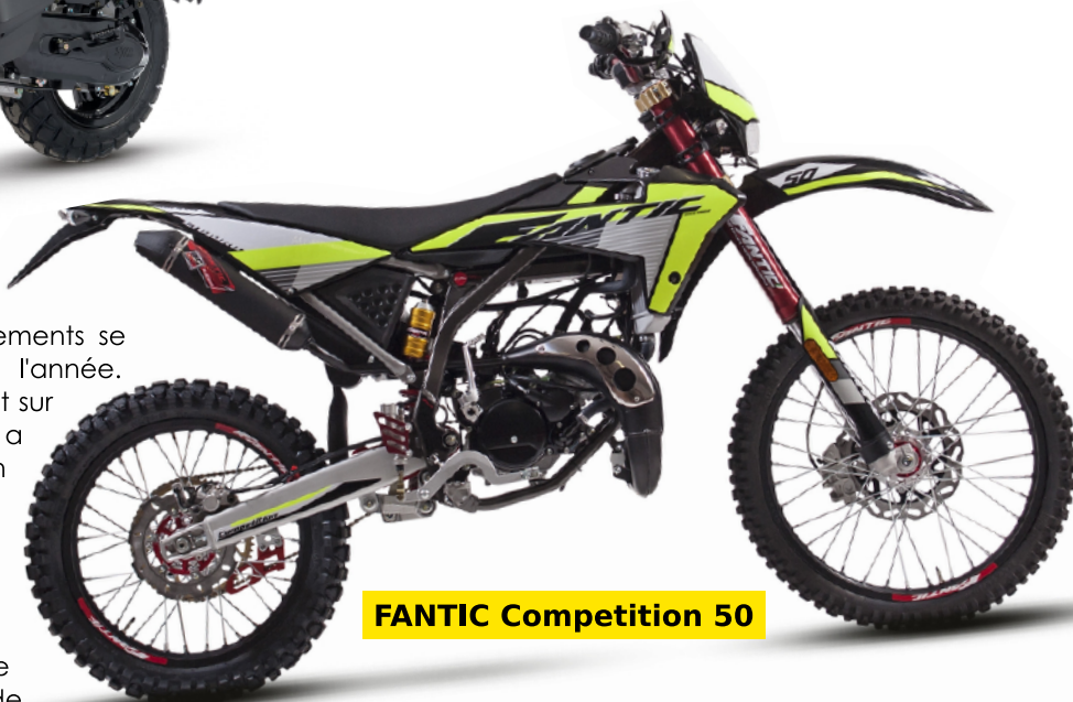
FANTIC Competition 50

Globalement, les constructeurs ont manqué de véhicules. Les approvisionnements se sont considérablement compliqués sur l'année. Cela a donc freiné les ventes et se ressent sur les chiffres. Rieju (en tête du classement) a tout de même réussi un coup de force en réalisant +291,1% sur Décembre 2020 et s'en sort donc le mieux grâce en partie à des immatriculations en masse de véhicules neufs avant l'arrivée d'Euro 5. Le deuxième du segment, Beta, ne s'en est pas aussi bien sorti. Sur le mois de Décembre ses immatriculations sont de +89,5% mais sur le total de l'année la marque termine dans le négatif : -10%. Cela étant dû en partie à un manque d'approvisionnement.