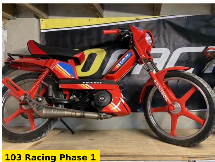
103 Racing Phase 1

Ce 103 Racing Phase 1 (ci-contre) fait partie aussi des modèles fidèles à l'origine. Tout y est, les carénages, les stickers, la couleur, la selle, la plaque phare... et petite touche en plus : on retrouve là aussi le pot GENCOD dans sa version rouge qui termine parfaitement son visuel.