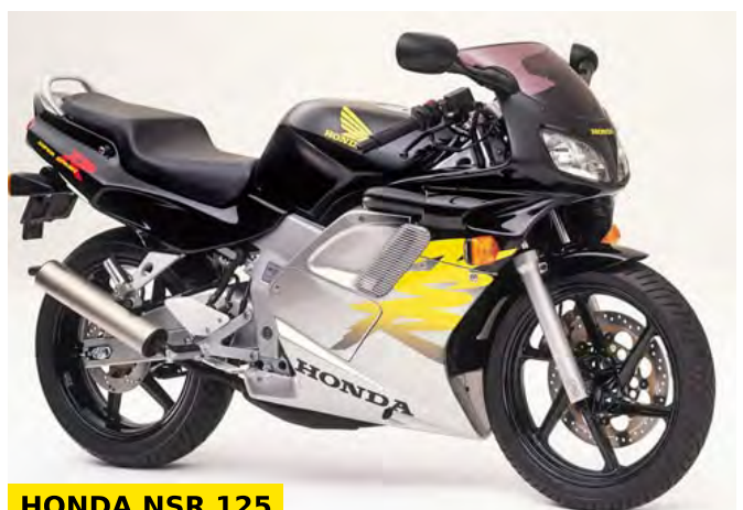
HONDA NSR 125

Pour une utilisation en ville, cela devient assez compliqué. En effet au vu de sa longueur, le rayon de braquage est énorme (demi-tour presque impossible) et les slaloms entre les voitures sont une épreuve car en dessous de 7000 tours le moteur manque de puissance. Cela dit elle décolle rapidement des feux rouges, même en version bridée à 15 chevaux. Mais c'est surtout sur route qu'elle développe réellement son potentiel avec une bonne vitesse de pointe et une bulle très efficace. La conduite sur autoroute, par contre, est possible mais potentiellement périlleuse si la moto n'est pas débridée. Ses freins très puissants, mais totalement gérables, étaient un vrai atout. Et compte tenu de la puissance de la moto, ils étaient bienvenus.