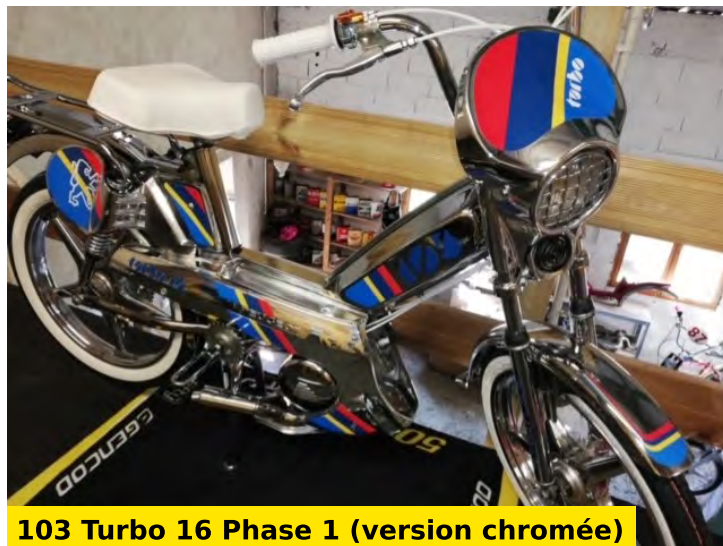
103 Turbo 16 Phase 1 (version chromée)

Toujours en reproduction d'origine, ce très beau 103 Turbo 16 Phase 2 immédiatement reconnaissable avec son ensemble blanc, ses bandes rouges, bleues, jaunes, noires et bien sûr ses logos "103" et "turbo 16" sur ses carénages. Une célébrité ! Hervé l'a d'ailleurs décliné en chromé (une version donc customisée) qui lui donne un look surprenant mais tout aussi beau que son modèle d'origine. Ce projet est équipé d'un pot Cobra, chromé lui aussi. Sur ce modèle, la plaque phare a été changée.