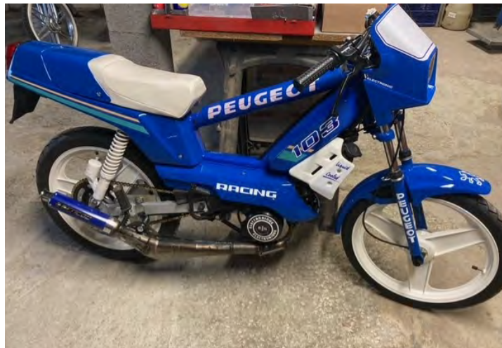
103 RCX LC Phase 1

On démarre avec les 103 RCX, avec dans un premier temps ce RCX Phase 2 vert et noir et son réservoir 5 litres. Sur ce modèle on retrouve un moteur liquide qui est d'origine. A côté, le RCX LC Phase 1 dans sa version bleue et blanche et son réservoir de seulement 3,7 litres. Sur ces deux modèles Hervé a mis un carburateur et une pipe d'admission de 15, et les deux sont équipés du désormais célèbre pot à pompe GENCOD en vert et en bleu.