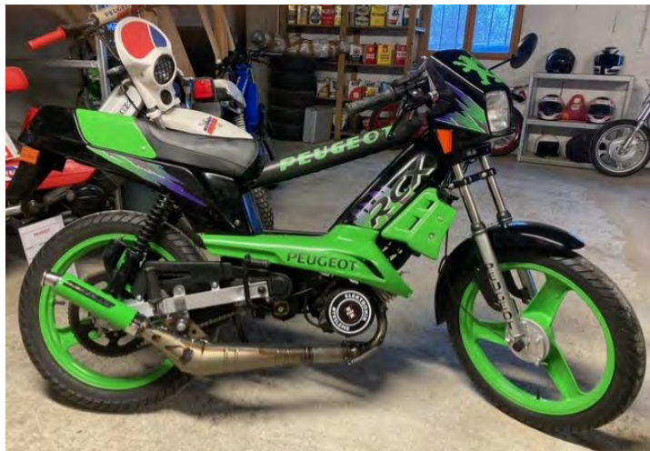
103 RCX Phase 2

Hervé, un passionné de mobylettes, nous a ouvert les portes de son garage pour nous présenter ses plus beaux projets. Et il y en a ! Voici un tour d'horizon de ces différents modèles, plus ou moins rares, totalement d'origine ou bien totalement customisés.