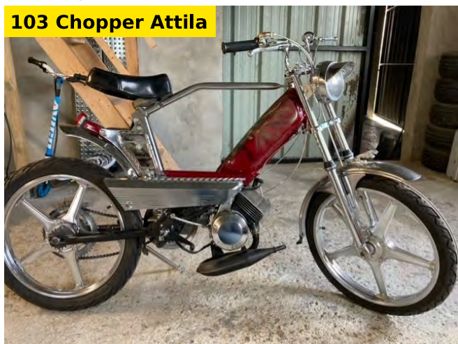
103 Chopper Attila

Mais cette collection ne renferme pas que des 103, on y retrouve par exemple ce très bel exemplaire de GL 10, et son moteur d'origine équipé d'un allumage rupteur. Cette mobylette des années 70/80 avait son réservoir sous la selle, comme vous pouvez le voir ci-dessus. Mais on découvre également un des 600 Country MXR fabriqués par Peugeot, ce petit deux-roues mi vélo, mi mobylette qui est un beau jouet pour les grands enfants ! Hervé est