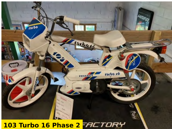
103 Turbo 16 Phase 2 FACTORY